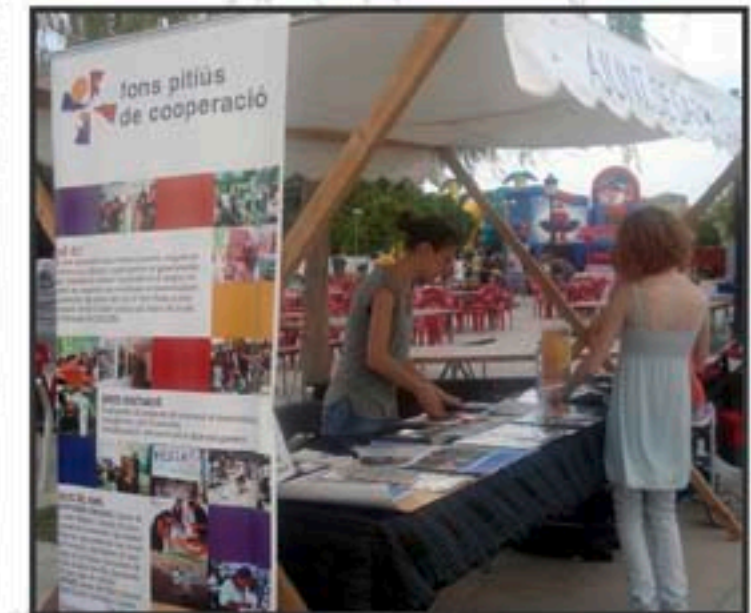
Dia de la Infància. Eivissa, 21 de novembre de 2010.